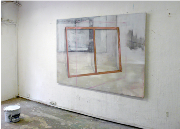
Vue d'atelier; 2011