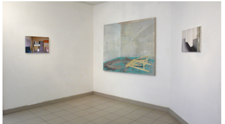
Vue d'exposition Artothèque Antonin Artaud, mai 2011