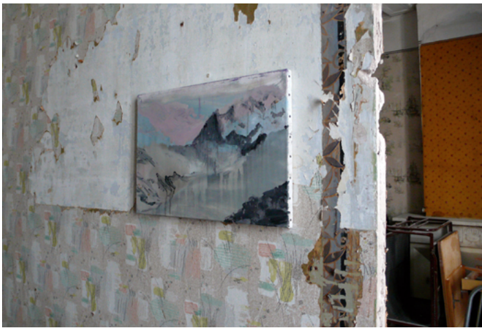
Photographie Mur 3, 2009